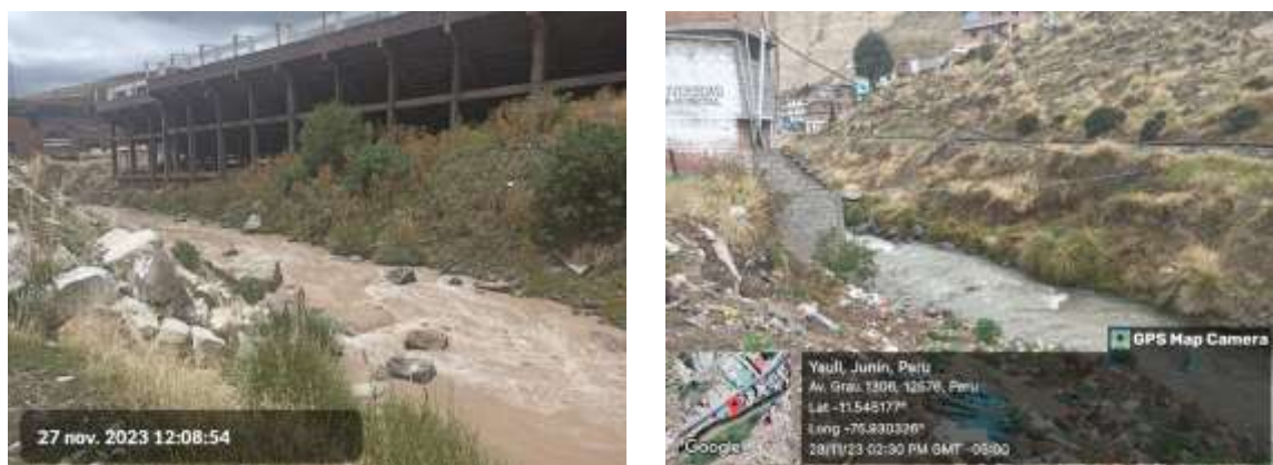
Imagen 2: Ubicación del terreno para la obra