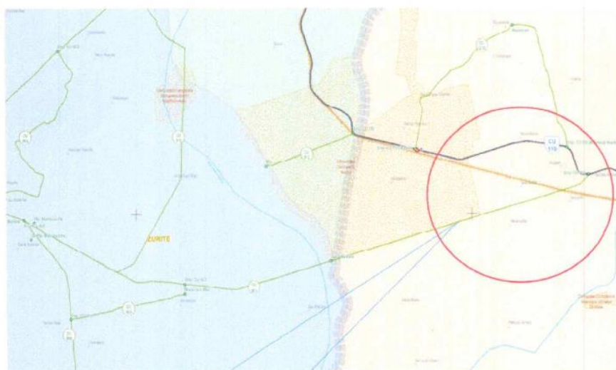
Camino Vecinal. Emp. Cu-902 (Zurite) - Occoruro (Emp. Cu-110)

El contratista debe cumplir los siguientes requisitos: