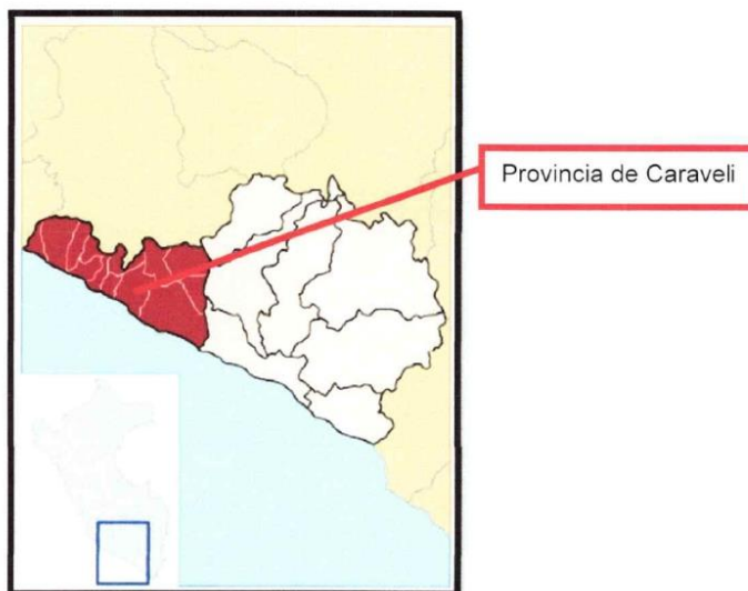
Figura N° 1 Ubicación General: Región Arequipa y Provincia Caraveli