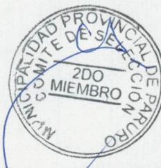
SEGUNDO MIEMBRO TITULAR