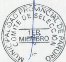
PRIMER MIEMBRO TITULAR