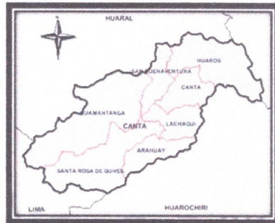
MAPA DE LA PROVINCIA DE CANTA

"Año del Bicentenario, de la consolidación de nuestra Independencia, y de la conmemoración de las heroicas batallas de Junín y Ayacucho"