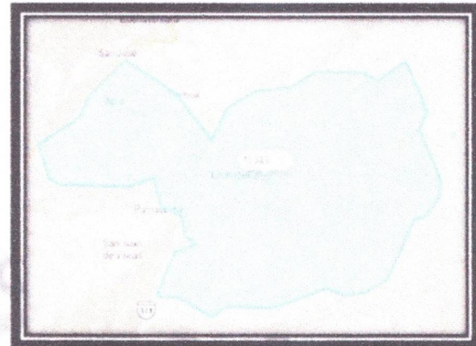
MAPA DEL DISTRITO DE LACHAQUI

Imagen satelital de la ubicación del sistema de Riego Quisquichaca.