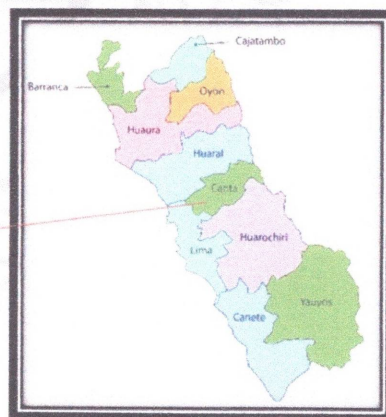
MAPA REGION DE LIMA

Jr. Francisco Bolognesi S/N Manzana G1 Lote 12, Centro Poblado Lachaqui - Lachaqui - Canta - Lima