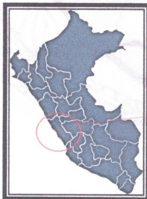
MAPA POLITICO DEL PERU