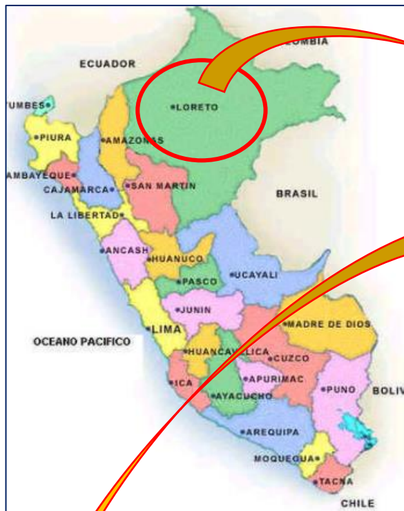
DEPARTAMENTO DE LORETO