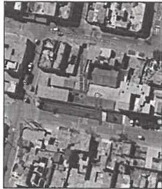
Ubicación del proyecto.

El área de terreno encierra una poligonal rectangular encerrada en estos linderos es de 839.70 m2; registrado a nombre del estado y representado por la Superintendencia nacional de bienes estatales; inscrito bajo el código del predio N° P01114910.