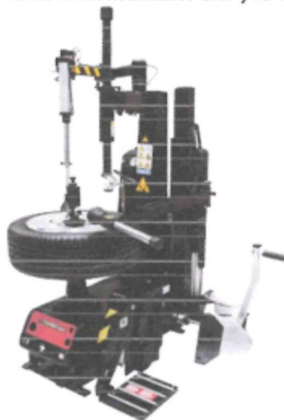
Ilustración imagen referencial

Rápido como una desmontadora de neumáticos con llantas de acero Evita daños en las llantas de los neumáticos UHP y RFT, y es fácil de usar