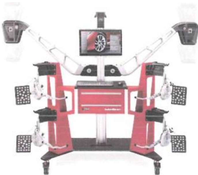
Ilustración Imagen referencial