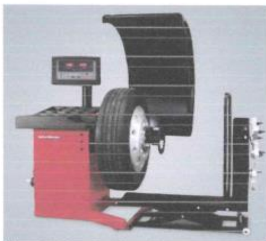
Ilustración 2 imagen referencial

Como accesorio opcional está incluido 4 conos para ruedas de automóviles