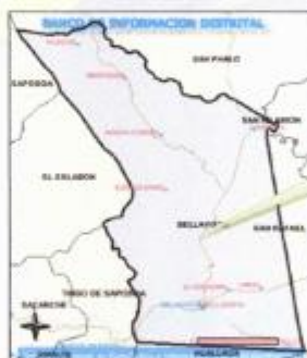
LOCALIDAD DE BELLAVISTA