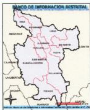
REGION SAN MARTIN

“DESARROLLANDO UN MEJOR FUTURO PARA TODOS”