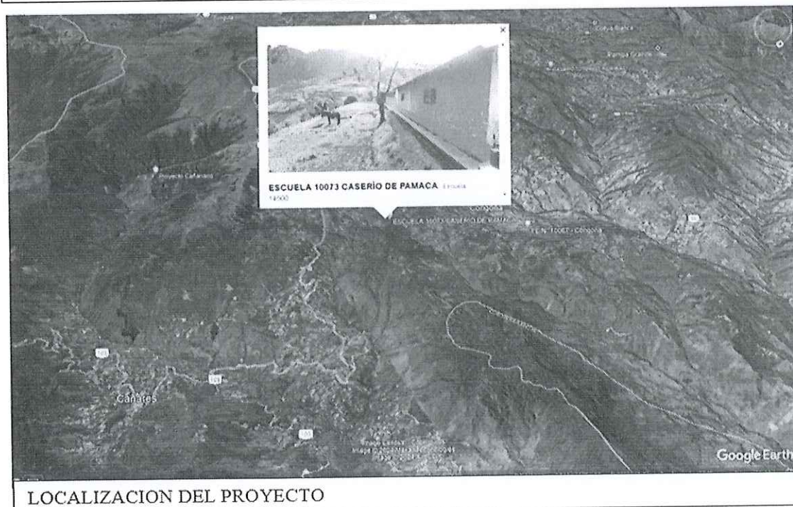
LOCALIZACION DEL PROYECTO