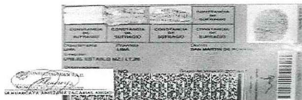
Imagen 2: pág. 07