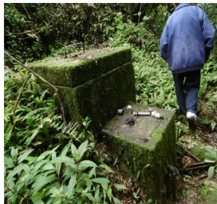
Captación existente en mal estado de conservación