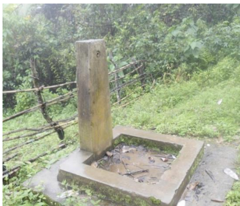
Pileta en funcionamiento, pero en mal estado de conservación