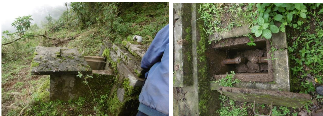
Imagen: Línea de Conducción existente en mal estado de conservación