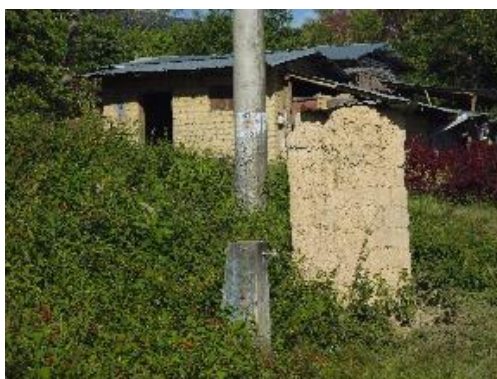
Imagen: Letrina en mal estado de conservación