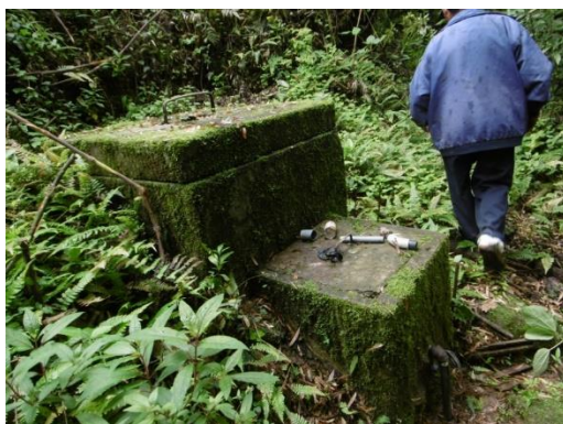
Imagen: Captación existente en mal estado de conservación

Se observa que el concreto está sufriendo desmoronamiento en forma acelerada.