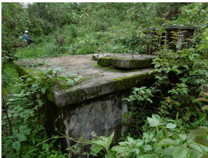
Imagen: Reservorio Inoperativo - Presenta Grietas