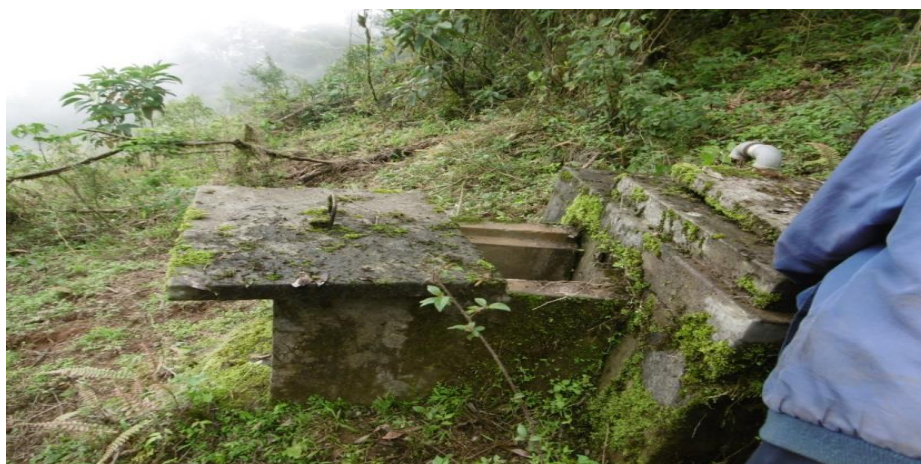
Cámara rompe presión, en malas condiciones