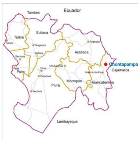
Ilustración 3: Caserío de Chontapampa