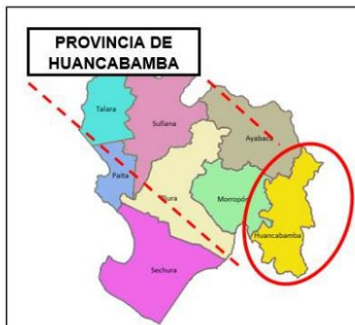
Ilustración 1: Provincia de Huancabamba en el departamento de Piura