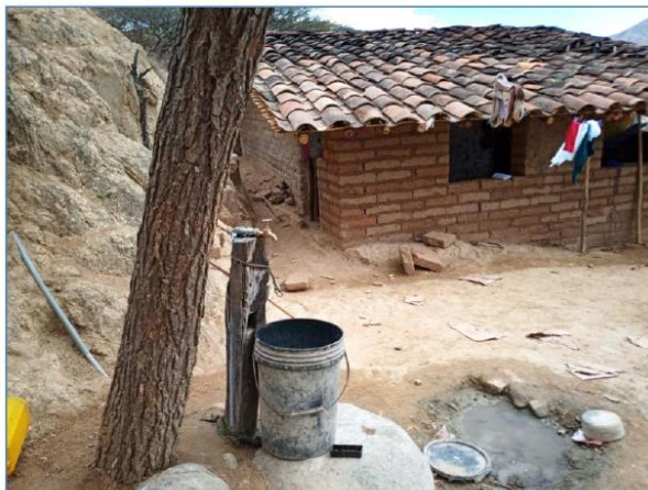
Ilustración 9: Conexiones domiciliarias actual en la localidad de Chontapampa.