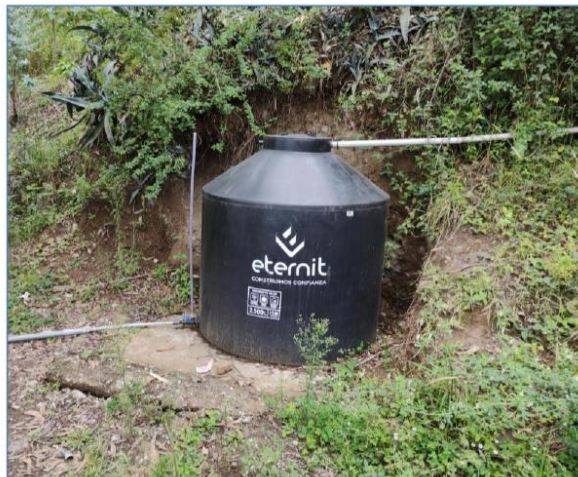
Ilustración 7: Vista de Tanque de PVC de 2500L de capacidad de almacenamiento.