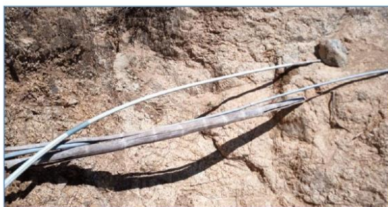
Ilustración 8: Red de distribución actual en la localidad de Chontapampa