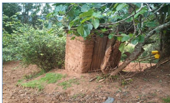
Elaboración: Equipo técnico