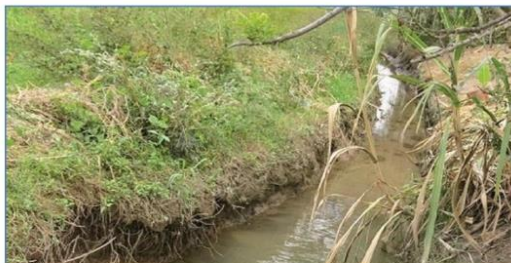
Ilustración 5: situación actual del canal de irrigación en Chontapampa