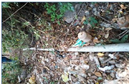
Ilustración 6: línea de conducción actual en la localidad de Chontapampa