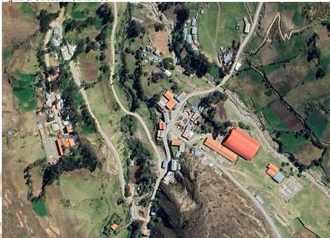
Figura 3. Ubicación Cambio 90