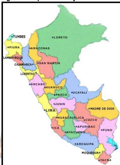
Figura 1. Mapa del Perú y Áncash