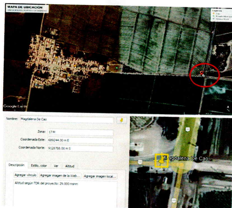
Imagen N° 2: Localización Del Proyecto

Plazo de Ejecución de Obra de 60 días calendarios, se han elaborado los Cronogramas Valorizados de Obra y de Desembolsos considerando dicho plazo.