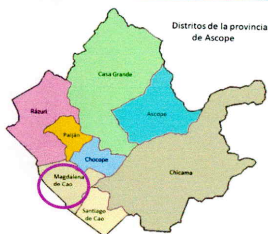
Imagen N° 1: Macrolocalización, provincial y distrital del Proyecto.