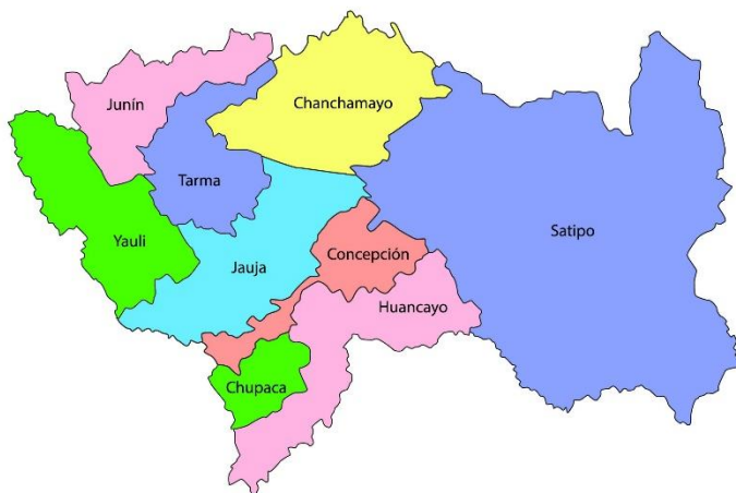
MAPA PROVINCIAL DE YAULI