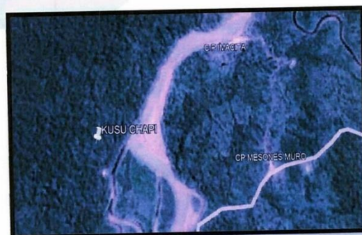
LOCALIZACIÓN GEOGRÁFICA DE LA LOCALIDAD DONDE SE UBICA EL IOARR