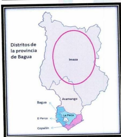
LOCALIZACIÓN GEOGRÁFICA DEL DISTRITO DE IMAZA