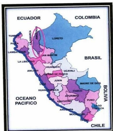
LOCALIZACIÓN GEOGRÁFICA DEL DEPARTAMENTO DE AMAZONAS