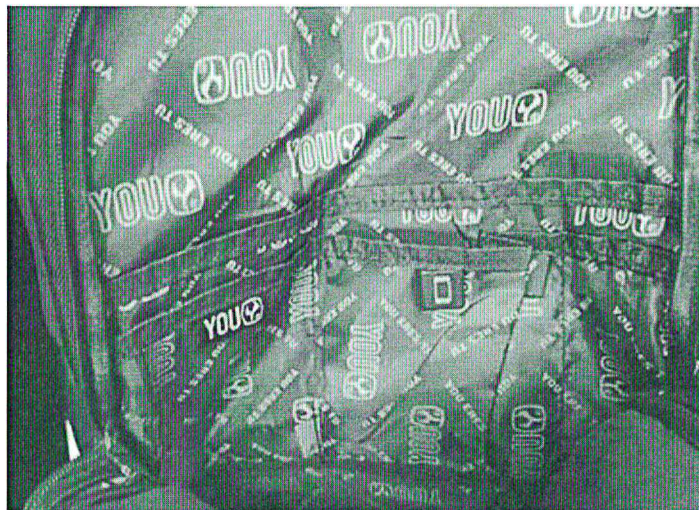
Imagen Interior 1

Programa Nacional de Alimentación Escolar QALI WARMA