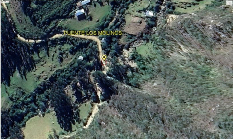
Imagen N° 3: Vista satelital del puente Los Molinos.

A continuación, se muestra la accesibilidad a la zona desde la ciudad de Trujillo.