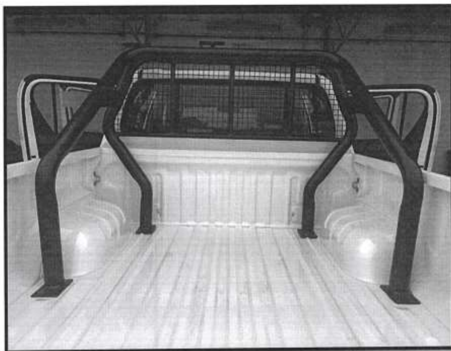
BARRA ANTIVUELCO BAJO LA TOLVA