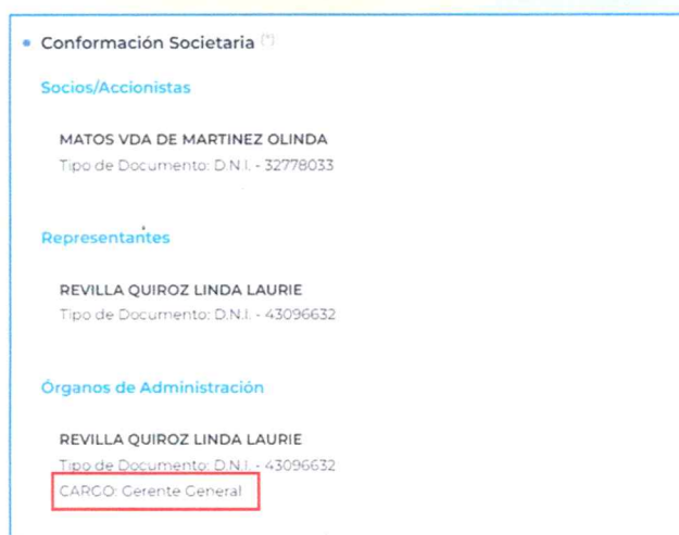
Captura 1: Consulta Búsqueda de Proveedores del OSCE (18/05/2023)