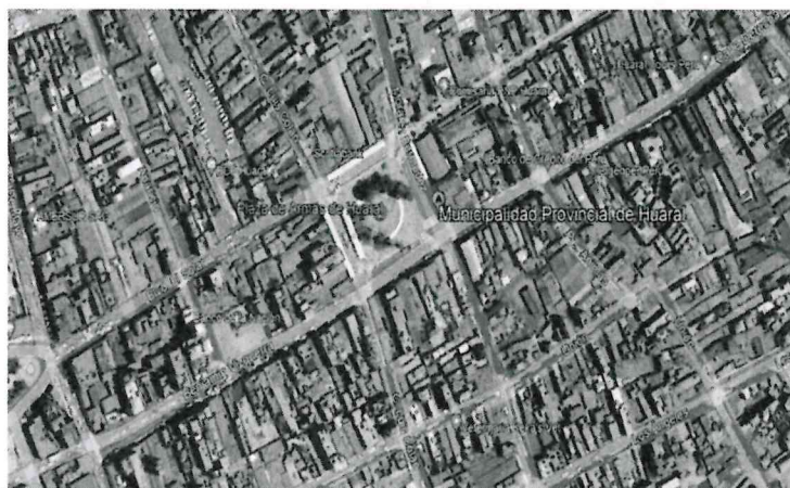
DISTRITO DE HUARAL