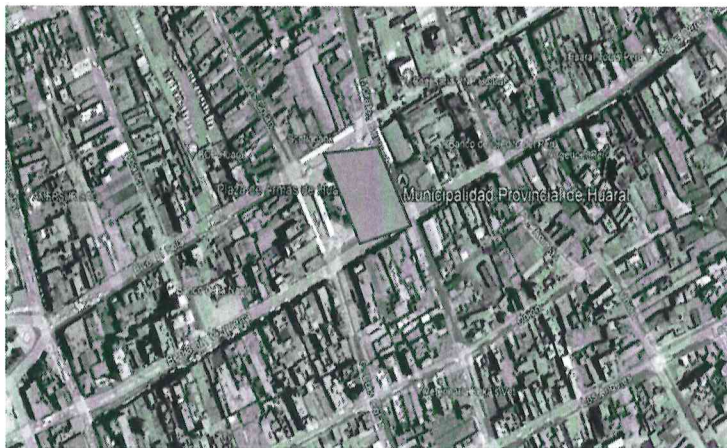
IMAGEN SATELITAL DEL ÁREA DE INTERVENCIÓN

En Huaral, los veranos son calurosos, húmedos, áridos y nublados y los inviernos son largos, cómodos, secos y mayormente despejados. Durante el transcurso del año, la temperatura generalmente varía de 16 °C a 28 °C y rara vez baja a menos de 14 °C o sube a más de 30 °C.