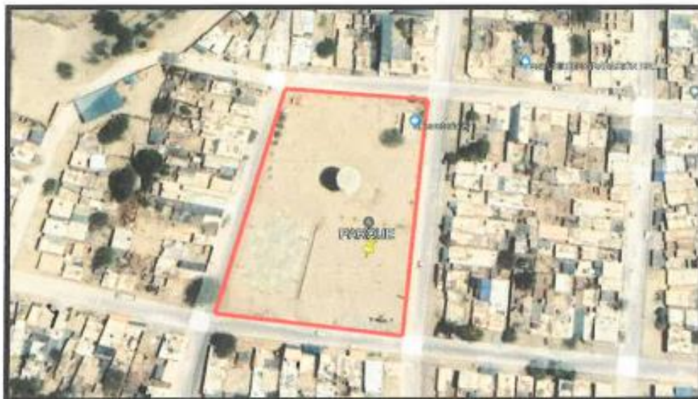
Ilustración 2: Ubicación del proyecto

Creada por Ley N° 5566-29 de noviembre de 1926