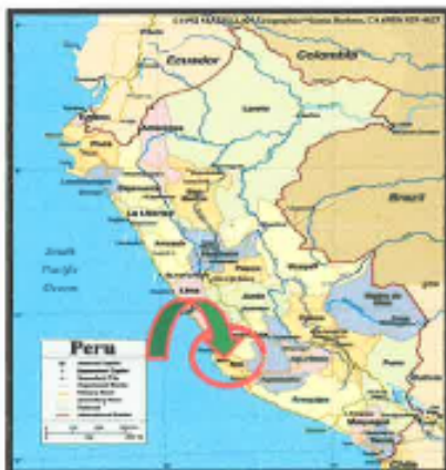
Ilustración 1: Mapa Político del Departamento de Ica