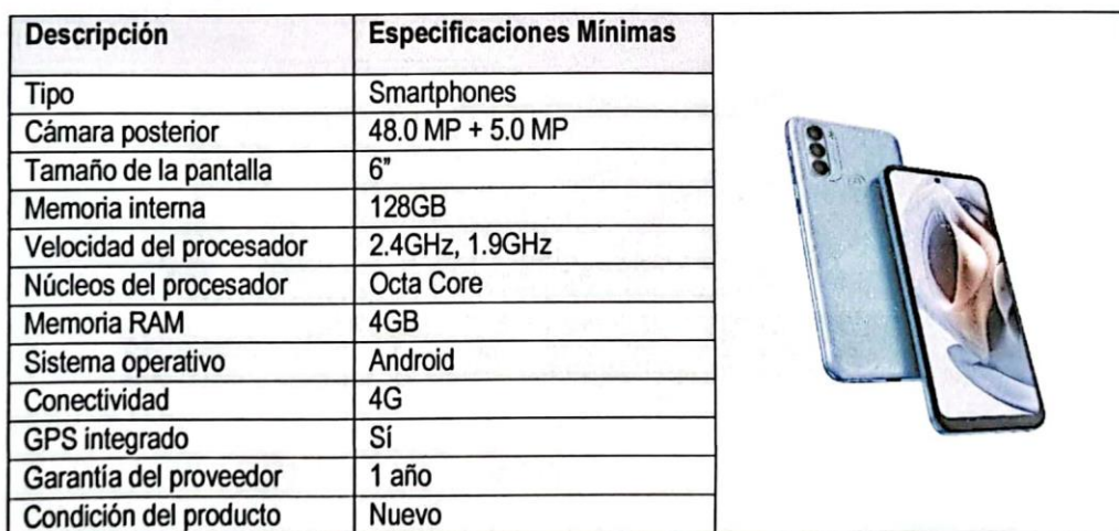
Tabla 3.1 Especificaciones mínimas de teléfonos celulares (imagen referencial)

Los equipos celulares deberán tener una garantía de 01 año como mínimo.