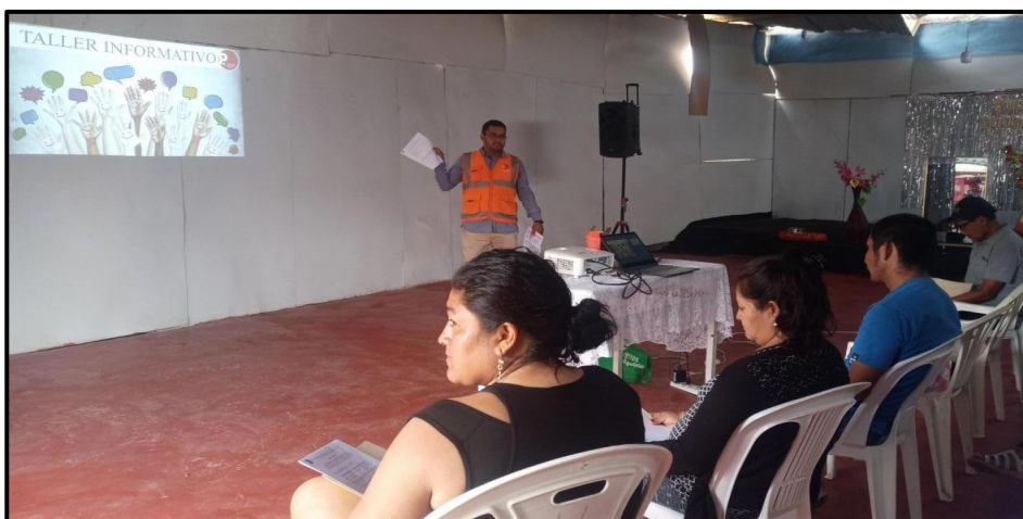
FOTOGRAFÍA N° 01 REGISTRO DE ASISTENTES A LA REUNION INFORMATIVA

En los siguientes cuadros se presentan los grupos de interés del proyecto: