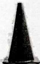
CONO DE SEGURIDAD