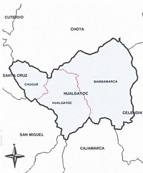
FIG. 02: PROVINCIA DE HUALGAYOC

"Año del Bicentenario, de la consolidación de nuestra Independencia y de la conmemoración de las heroicas batallas de Junín y Ayacucho"