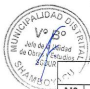
Tabla de Penalidades

Cabe precisar que la penalidad por mora y las otras penalidades pueden alcanzar cada una un monto máximo equivalente al diez por ciento (10%) del monto del contrato vigente.