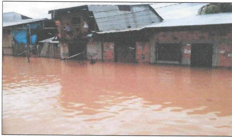
Vista de la zona urbana inundada

El problema que presenta la zona urbana de Alfonso Ugarte es que en tiempos de máximas avenidas se inunda y afecta a todo la parte baja de la Ciudad, causando pérdidas materiales y hasta pérdidas humanas, pues el nivel del agua alcanza un nivel de hasta 1.00 m en las viviendas que se encuentran en los puntos de relieve menor. Tal como se puede apreciar en la siguiente imagen: