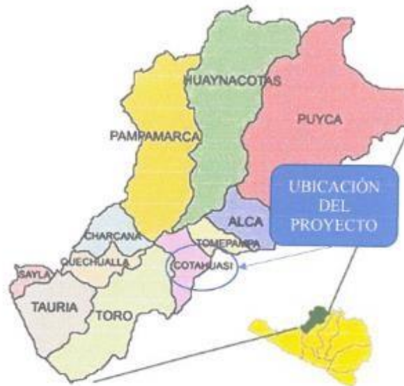
Figura 1: Ubicación Provincial del proyecto