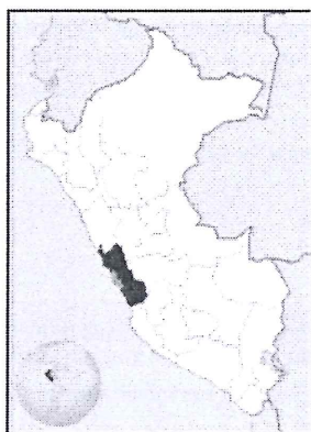
UBICACIÓN GEOGRÁFICA DEL DEPARTAMENTO DE LIMA

Región : Lima Departamento : Lima Provincia : Lima Distrito : LA VICTORIA