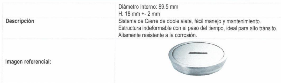
TABLA 25. REGISTRO CON ROSCA DE BRONCE CROMADO 2"