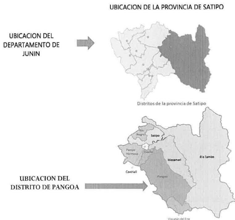
Gráfico N° 1 Macro localización del proyecto