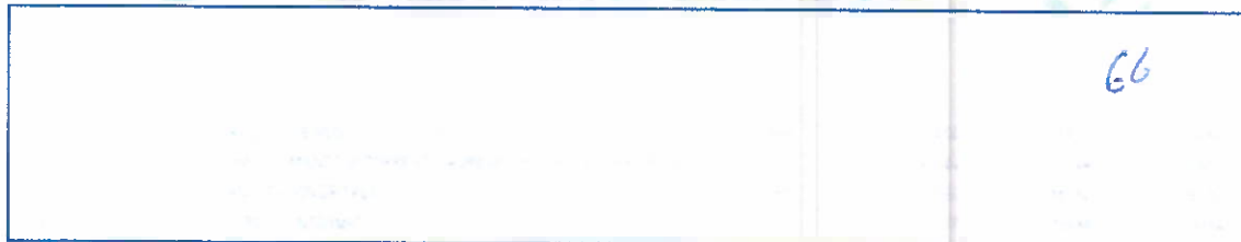
IMAGEN EXTRAÍDA DE LA PAGINA 66 DE LA PROPUESTA TÉCNICA. SEGÚN FOLIACIÓN PRESENTADA POR EL POSTOR.

2 Para mayor información sobre la normativa de firmas y certificados digitales ingresar a https://www.indecopi.gob.pe/web/firmas-digitales/firmar-y-certificados-digitales