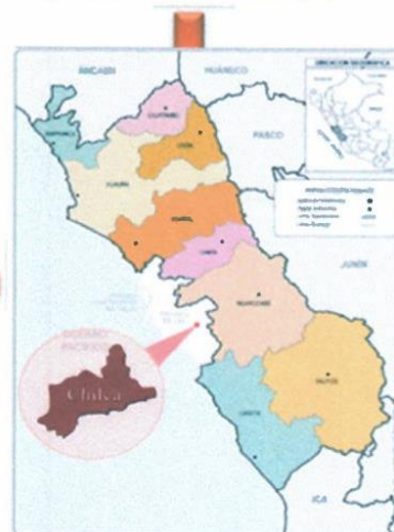
Ubicación: Imagen satelital de la ubicación del área a intervenir