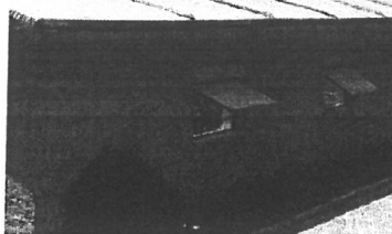
Fotografía referencial de ventana de madera

"Decenio de la Igualdad de Oportunidades para Mujeres y Hombres" "Año de la Recuperación y Consolidación de la economía peruana"