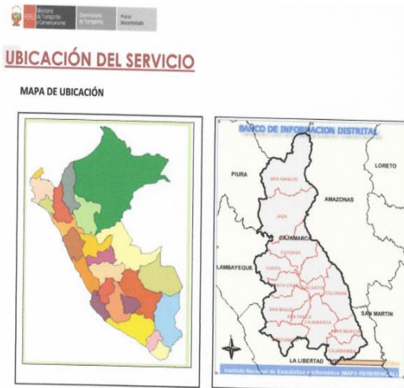
MAPA DE UBICACIÓN

Departamento: CAJAMARCA Provincia: CHOTA Distritos: CHALAMARCA, CONCHAN