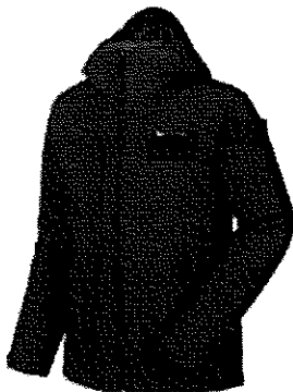
Casaca Impermeable (Foto referencial)

Para la muestra , el proveedor adjudicado presentará como mínimo una prenda de preferencia talla M, para determinar color y modelo.