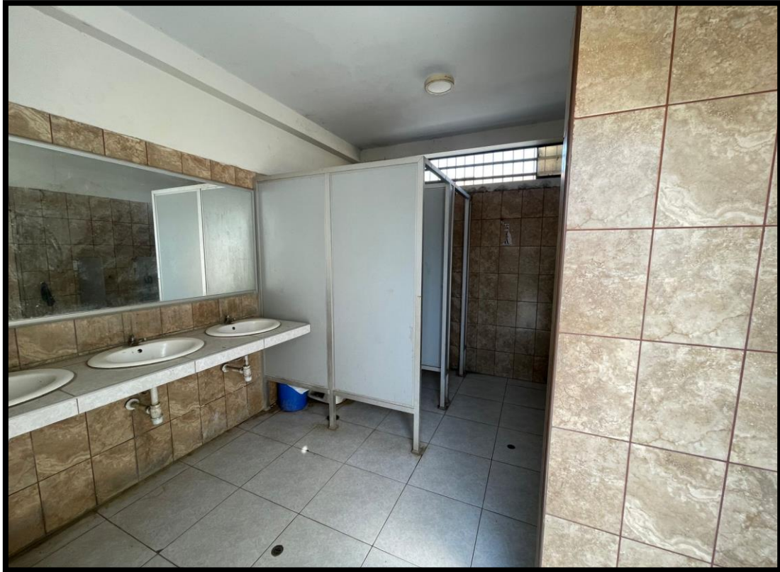
Figura N° 6: Vista de Baños Existentes