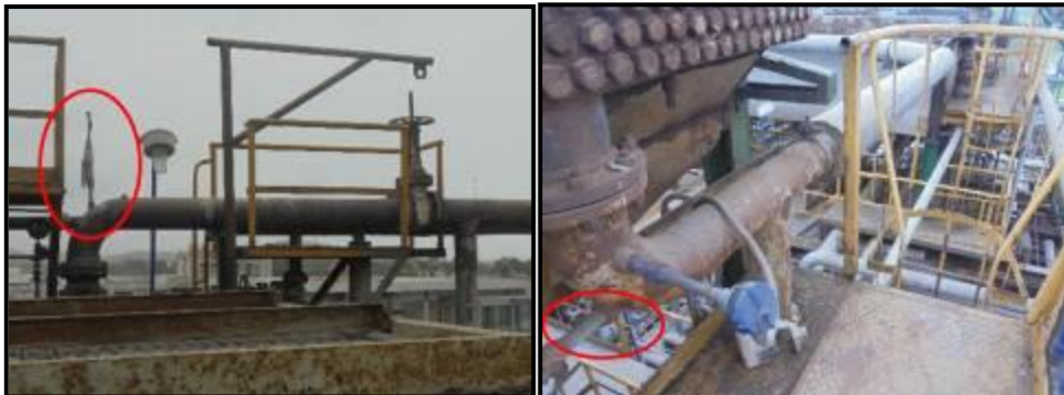
Ubicación de Probeta a la entrada de Aerorefrigerante E-32 y a la salida de este.

Posee dos (02) probetas de corrosión tipo ER ubicadas una en la entrada del Aerorefrigerante E-32 y otra en la salida, tal como se muestra en la imagen: