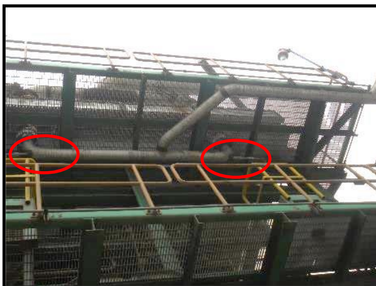
Después de Salida de Aerorefrigerantes E-6A y E-6B