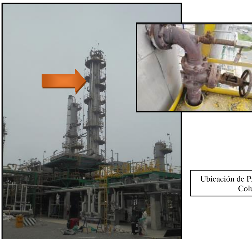
Ubicación de Probeta de Corrosión en Columna C-1A

Posee una (01) probeta de corrosión la cual se encuentra ubicada en tercera plataforma (contando desde arriba como la primera en donde se ubican las Válvulas de Seguridad) conectada a la salida de vapores de retorno de Solvente, tal como se muestra en la siguiente imagen: