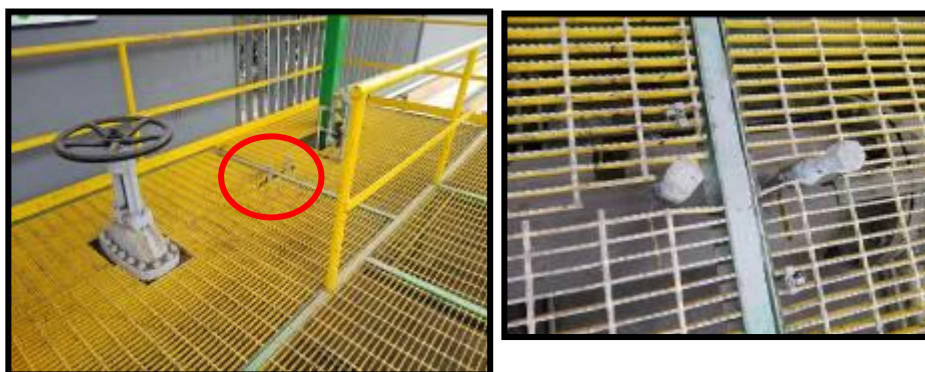
Ubicación de Probetas de Corrosión en LSN2

Posee dos (02) probetas de corrosión tipo ER ubicadas en la línea submarina LSN2 tal como se muestra en la siguiente imagen: