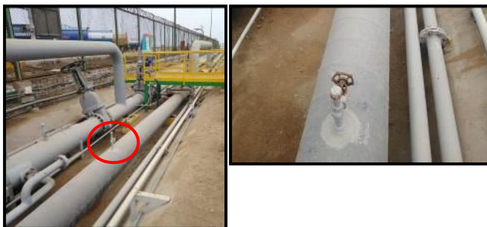
Ubicación de Probeta de Corrosión en LSN1