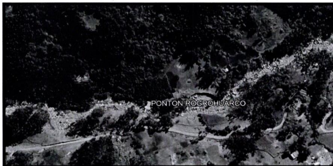
Lugar de ejecución de la Actividad.