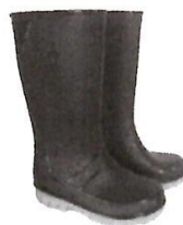
Botas de Jefe