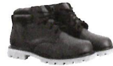
Botines cortos de Jebe