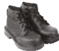
Zapatos de Seguridad con Punta de Acero