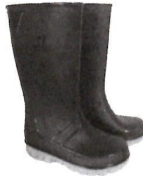
Botas de Jebe