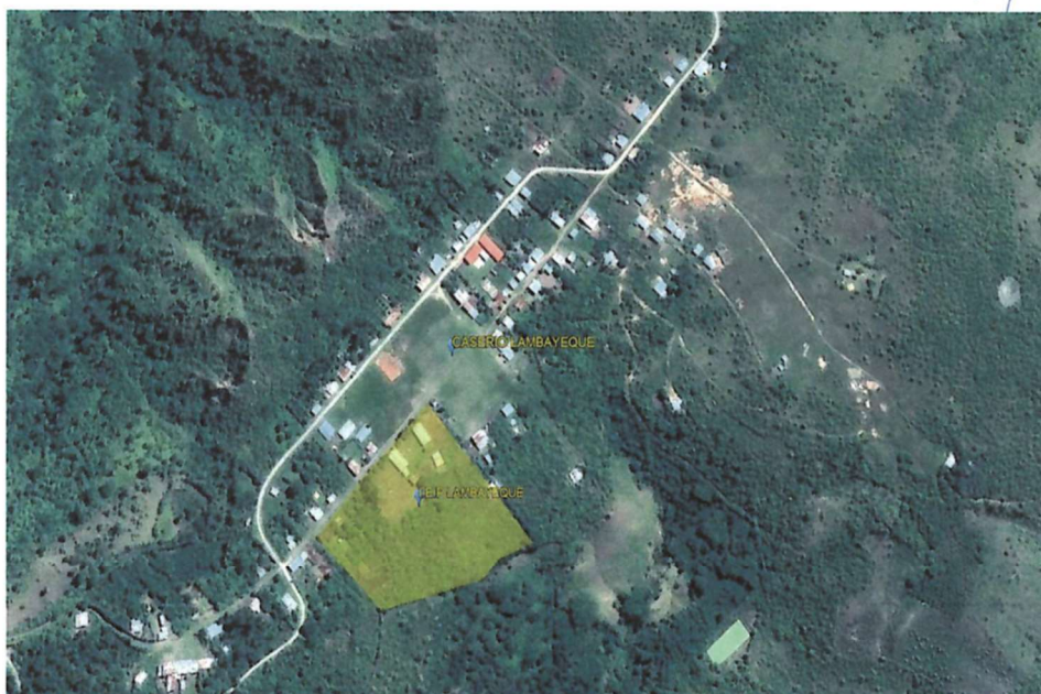
IMAGEN 01: LOCALIZACIÓN GRÁFICA DE LA LOCALIDAD DE LAMBAYEQUE

MUNICIPALIDAD DISTRITAL DE CHIRINOS UNIDAD DE ESTUDIOS Y FORMULACIÓN DE PROYECTOS UE&FP [Firma]