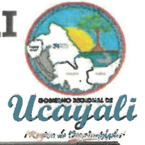
IMAGEN N.º 01

TRAMO DEL CAMINO DEPARTAMENTAL UC-111 ENTRANDO POR EL KM15