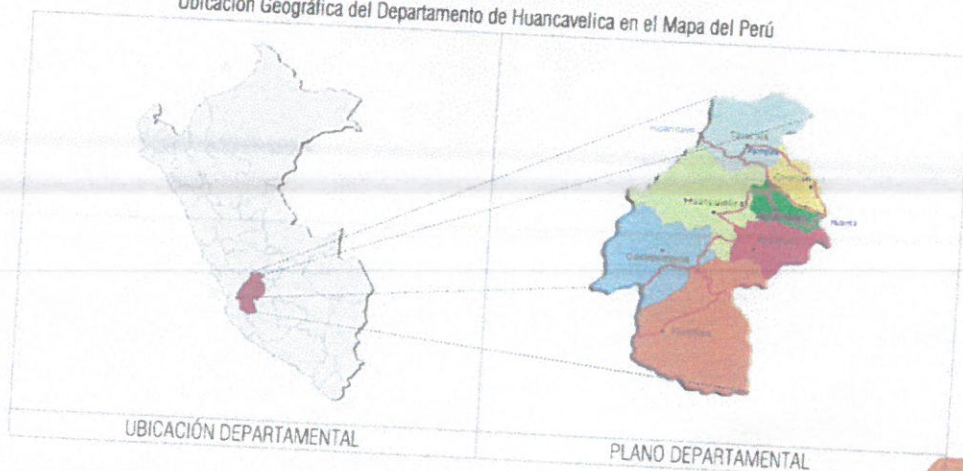
Ubicación Geográfica del Departamento de Huancavelica en el Mapa del Perú

Región : Huancavelica Provincia : Tayacaja Distrito : Surcubamba Centro Poblado : C.P. de Jatuspata