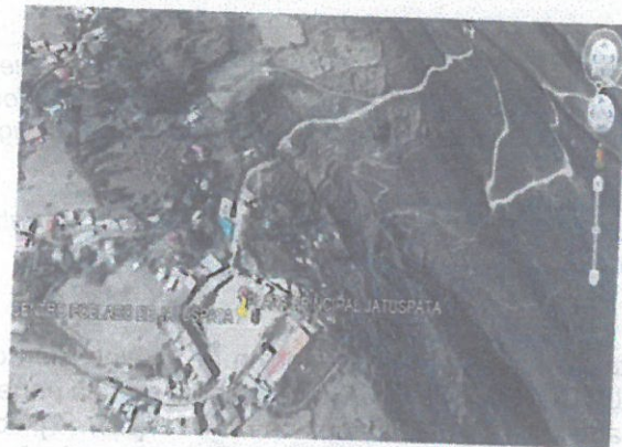
AMBITO DE INFLUENCIA DEL CAMINO VECINAL

Creado como Distrito el 22 de Julio de 2015 "Reserva Ecológica, Turística y Minera" 0035