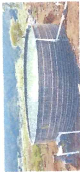
Figura: Corte transversal de geotankes

El geotankes consta de soporte de malla y postes metálicos como paredes, una manta de geomembrana de 1.5 mm tipo bolsa, fijados con grapas metálicas y cintillos de nylon, la corona del geotankes es asegurado con manguera de jardín de 1/2" y manguera de hdp de 32mm.