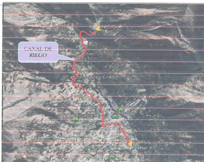
Figura 03: Imagen satelital de la ubicación del proyecto (canal de riego) – localidad de Veracruz