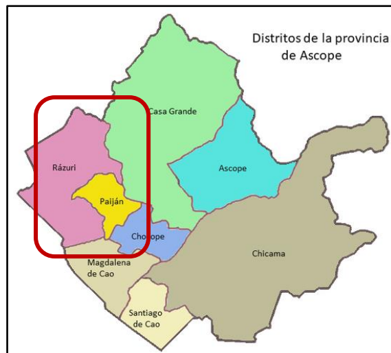
Figura N°3: Ubicación geográfica del distrito de Rázuri.