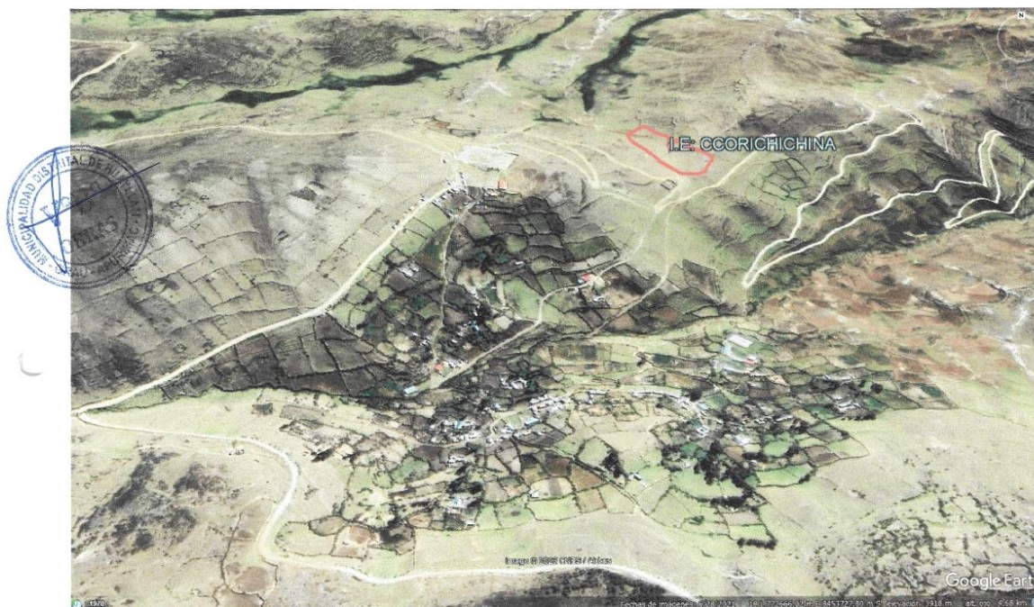
Vista de la I.E: CCORICHICHINA.

Este : 772875.99 m Norte : 8454169.68 m Elevación : 3,910 msnm.