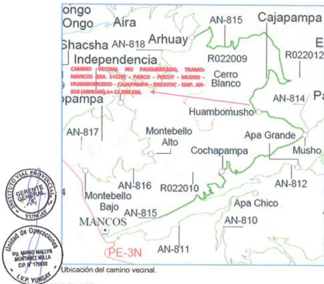
Ubicación del camino vecinal.

Distrito(s) : Mancos, Ranrahirca y Yungay Provincia : Yungay Departamento : Ancash