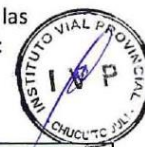
CUADRO NORMAS DE EVALUACIÓN PRIMERA PRIORIDAD: SEGURIDAD DE VIAJE.

Primero: Las causales para la aplicación de penalidades que figuran en las Normas de Evaluación de la Gestión de Mantenimiento, son las siguientes: